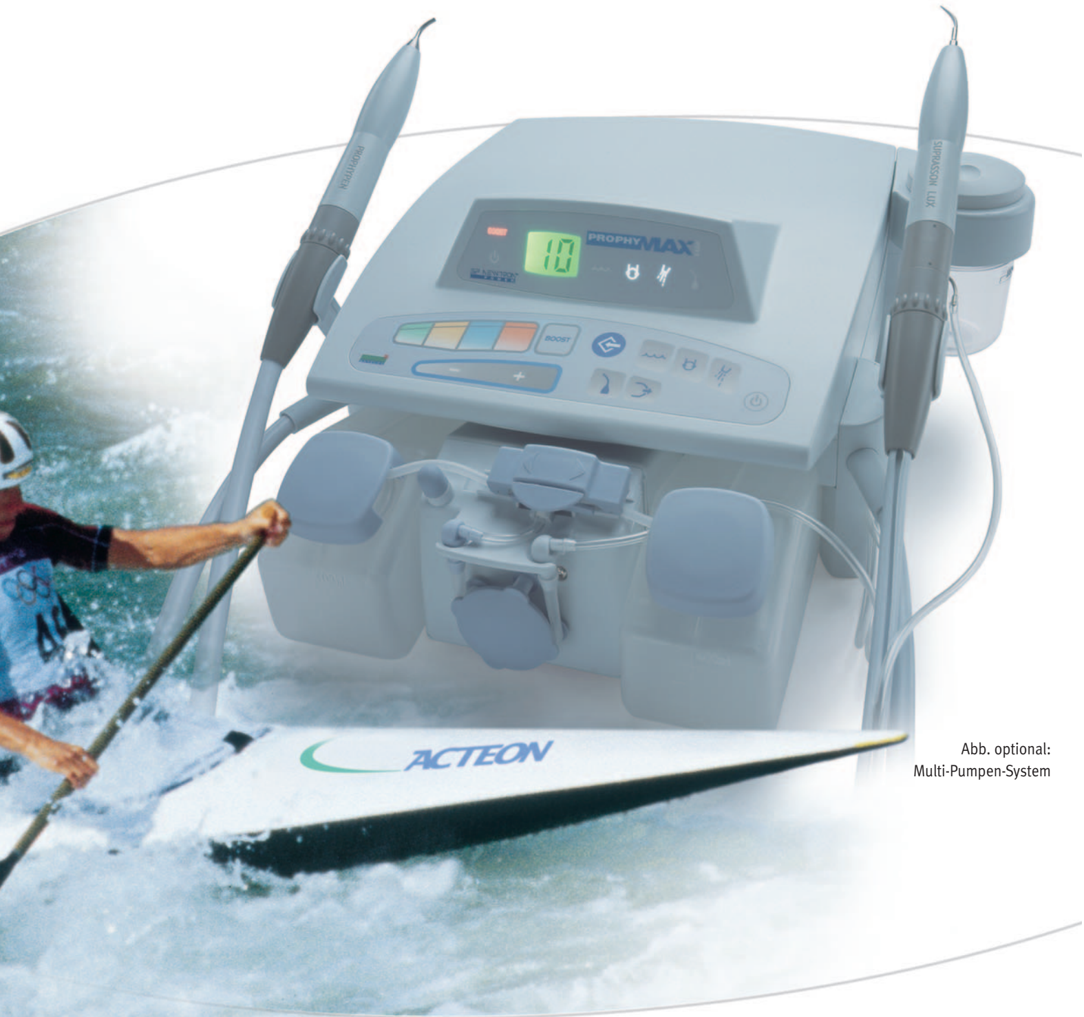
Abb. optional: Multi-Pumpen-System